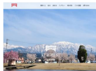
黒部市移住定住サイト 「KUROBEST」