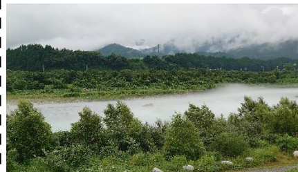
E. 川霧が出ています