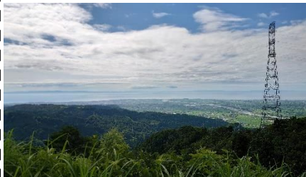
C. 大理石からの景色