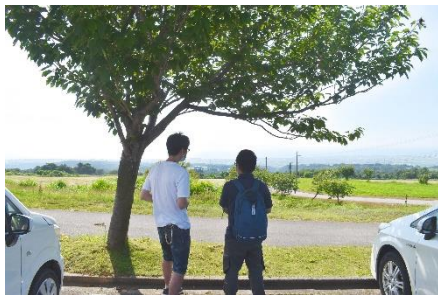
くろべ牧場から市内を説明！

元々ご興味があったこともあり、質問もたくさんいただきました！震災を体験されている方で、津波など自然災害に関する意識も高く、勉強になりました！ 自然が好きとのことで、山間部も見学。 気に入っていただけたとのことで、予定変更して山間部地域や伝統文化などを見に行きました！色んな地域を見に行っているとのことで、黒部を気に入ってもらえたらいいな～！(Y)