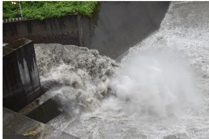
排砂風景も迫力あり！