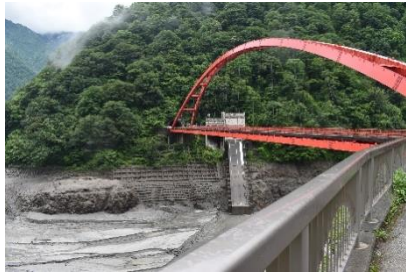
水位がいつもと違い少ない

年に一回の連携排砂(れんけいはいさ)を見ました！ 出身地では、近くにダムがなく、連携排砂の言葉を初めて 聞きました！この日の川や河口付近は泥の色に……。 連携排砂の詳しい内容を聞きながら、見て回りました。 普段とはまた違った宇奈月ダムが見れて満足しました！ 来年は夜の連携排砂を見に行こうかな！(Y)