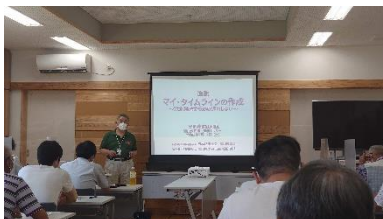
マイ・タイムライン作り