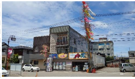
A. 大きなセタ祭り(7月撮影)