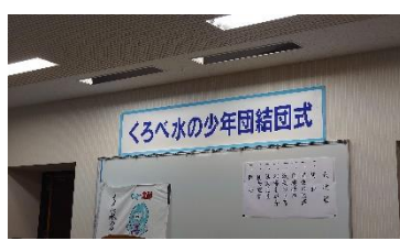
今年も始まりました！