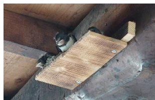
ツバメの巣立つ前