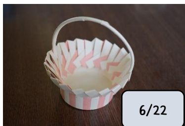
完成したバスケット