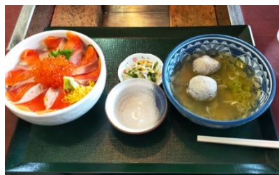
【魚の駅生地 親子丼】

出身地：岐阜県岐阜市 生年月日：1994年4月12日 血液型：AB型 趣味：野球（実践・観戦） 好きな食べ物：麺類、お肉 嫌いな食べ物？：マヨネーズ 得意だった科目：社会、理科