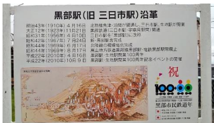
C. もとは三日市駅でした