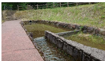
A. ちょっと登ります