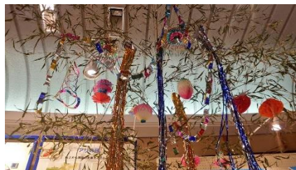
F. ささのはさ～らさら