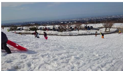
C. ソリで滑ってます