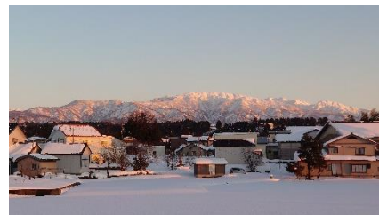
B. 夕焼け色に染まっていく