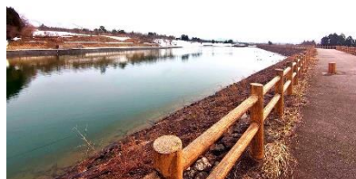
E. ぐるっと1周できます