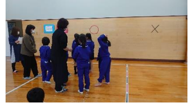
節分にまつわるクイズ

2月2日はなんの日だったのでしょうか? そう「節分の日」です。今年は何と124年ぶりに2日が節分となりました。この日は中央児童センターにて節分会が行われました。最初に子ども達と節分にまつわるクイズをしたのですが、今の子ども達は節分についてほとんど知らない事を知りました。「ヒイラギにイワシの頭を飾って…」とお話すると子ども達は『?』となっていました。新しく覚えて帰ってね♪その後、鬼のお面を一緒に作りしました。出来上がった子ども達の鬼の面は怖いというよりかわいい鬼となりました。その後鬼が鬼に向かって豆を投げるといふ新しい豆まきが開催。私もしっかりと豆を投げられました。(I)