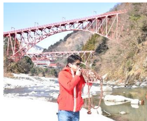
参加者の法螺貝披露