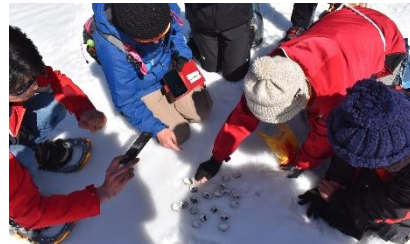
動物足跡貝合わせ