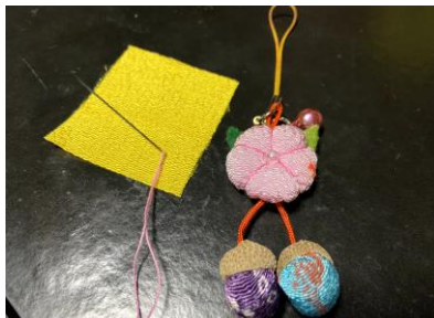
【教わりながらチクチクと】

や、お孫さんが好きなキャラクターなど★そしてその中にお釈迦さまのご遺骨に例えて作られた色とりどりのお釈迦団子を入れるのです!これは法要の際に撒いて(当たると結構痛い)食べたりもします!米粉で作られたお団子はストーブの上で焼いたりゆでたり、みんなのおやつに!お守りは交通安全や厄除けなどの御利益があるそうで、完成したら周りに配るそう!毎年200個ほど作ることも!早業・・・!富山のあたたかい風習ですね♪