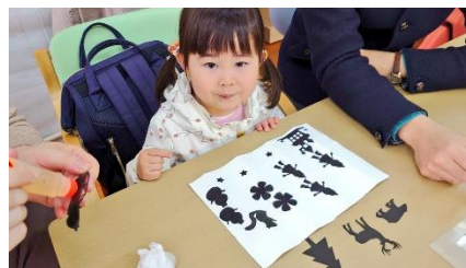
F. 上手にできたかな?