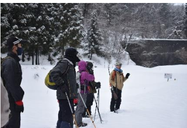
動物の痕跡を感じる