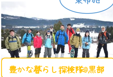
豊かな暮らし探検隊@黒部