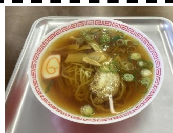
チャーシューもグッド！