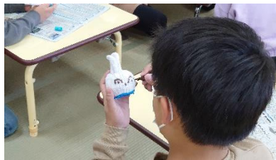
ウサギになったかな？

公民館の職員さんと一緒に宇奈月小学校に工作教室の講師として行きました。宇奈月小学校の学童の子ども達と「軍手で作るうさぎヨーヨー」や「紙皿で作るコマ」を作りました。子ども達は自分のウサギやコマを描いて、遊んでいました。お外で遊べない時には是非家で作って楽しんでもらいたいと思いました。