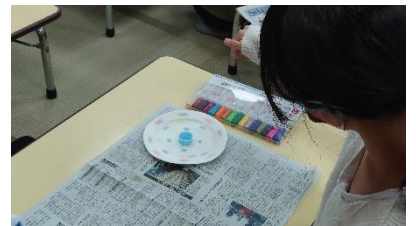
キレイに回ってます