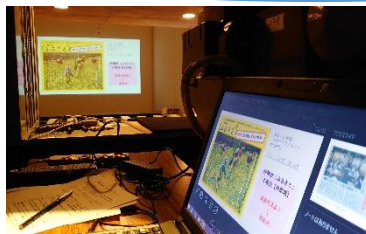
スライドショー担当