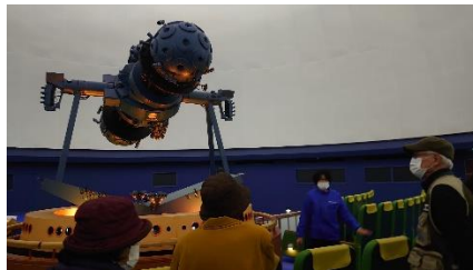
C. この機械何かわかります？