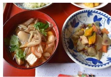
教わったフクラギのお雑煮