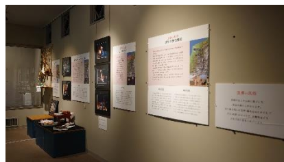
B. 伝統行事がいろいろ