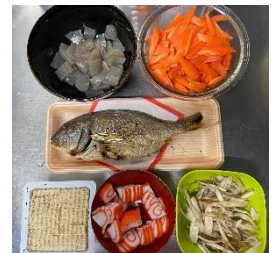
焼鯛で作ってみました！

昨年未より、黒部の「お雑煮」の作り方を教わったり、食べさせていただきました。市内でも地域や家庭により入れる具材、特に魚が違うのがとてもおもしろいところ。フクラギとサバのお雑煮は食べさせていただき、教わった作り方で自らは鯛のお雑煮を作ってみました。どれも味わいが違い、欲張りな自分はどれも美味しいw黒部の方々には毎年当たり前のよううんまいお雑煮を食べとられたんですね！お雑煮革命が起こったこの正月！鶏肉のお雑煮もあるとも聞いていますし、まだまだ奥が深そうな黒部のお雑煮。早くも来年が楽しみですw色々な黒部料理、教えてくださいね！