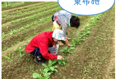
獣害も間近で学びました。