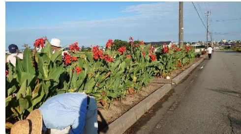
長い花壇を分担して