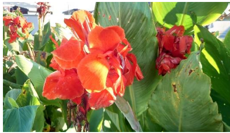
カンナが咲き誇ってます

前沢にある「カンナロード」。球根を植えたらおしまいではなく、地域の方たちが水やりや雑草を抜いたりなど大切に育てています。この日は早朝から雑草を抜くのお手伝いしました。こうした地道な活動を知ると一層カンナがキレイに見えますね♪