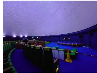
普段とはちょっと違う様子