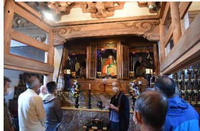
全龍寺のアレコレを教わります。