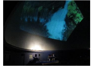
音楽と映像のコラボ

中央児童センターにて、ミニブーケ作りが行われました。ブーケのお花は子ども達が植えたお花（vol.20参照）を中心に色とりどりのお花で作りました。千日紅やマリーゴールドのような鮮やかな色のお花が人気で、思い思いのブーケを活けていました。完成したブーケを手写真を一枚♪