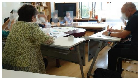
当時を振り返ります