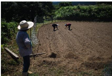
種植えるところはまだまだ暑い