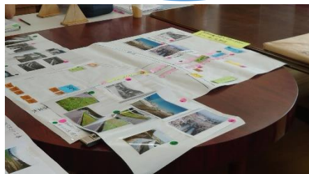
今と昔の写真たち

浦山公民館にて「あくわく浦山まちめぐりガイド育成」事業の一環にて浦山の昔の発電所のお話を聞きました。今ある黒西第一発電所の前身である板屋の発電所について思い返しました。今では聞かない単語が色々飛び交って、「黒部川電力株式会社、姫川電力、ダットサン」など地域の皆さんは懐かしがっていましたが、私はポカンとなり後から解説してもらいました。そこから今後の浦山について皆さんの思いを語り合いました。これからどうなっていくのか、楽しみです♪