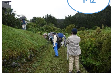
これが中世の山街道だ！！

福平開拓で大根の栽培が始まりました。今年は畝作りも担当させていただきましたが、だいぶ畝が低く大きくなるか心配です。協力隊3人で種まきもやらせていただき、無事に発芽し、菜っ葉すぐりを実施。早くも猿が菜っ葉にイタズラをしていました。農家さんもこの早いタイミングでの被害は初だそう。獣害があり耕作は簡単ではありません。ですが、すぐり菜を食べると…なんて柔らかく香りがいいこと！農家さんは標高と気候がおいしくさせると言いますが、獣害と闘いながら一生懸命作られるからこそそのおいしさであることは言うまでもありません☆