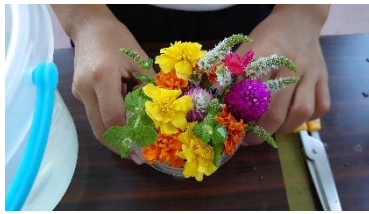
上手に活けました