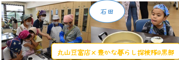
丸山豆富店×豊かな暮らし探検隊@黒部