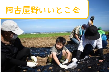
阿古屋野いいとこ会