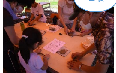
唯一無二のマイそばちょこ

「枝豆収穫から始まる夏ジビエ BBQ」が8/9開催。市内外からの親子が愛本の探検隊さん畑で枝豆をはじめ夏野菜を収穫し親子で BBQ 準備。どやまらんどキャンプ場でとれた野菜と黒部で捕獲された「鹿」肉を焼いて、黒部の恵みを感じながら夏 BBQ を楽しめました。子供たちは自分で収穫したものを準備し食べて嬉しそう☆大人の方は食べる機会の少ない鹿肉をおいしそうに頬張っていました！畑〜どやまらんど間は田園散歩やお寺で鐘撞きなど愛本ひばり野交流会さんのガイドを楽しみました☆次回 10/18 は大豆と枝豆でずんだ、きな粉おはぎ作り！