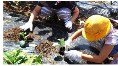
地域の方と一緒に