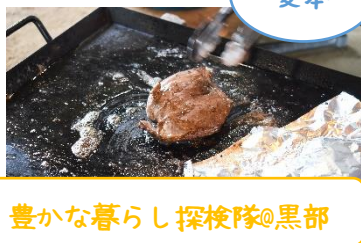
豊かな暮らし探検隊@黒部