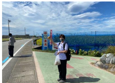
早速、梨農園さんへ☆