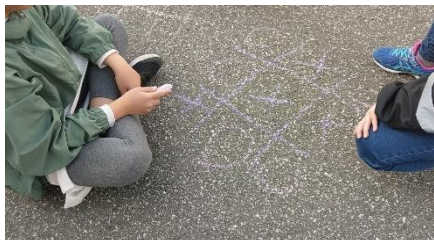
〇×ゲームもやりました!