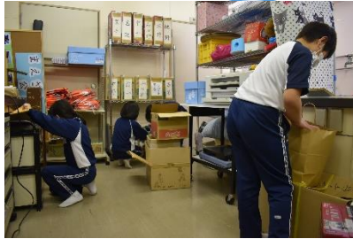
徹底的に探しています!

前沢公民館にて公民館を舞台とした宝探しゲームが行われました。主事さんが誠心誠意お宝へと続くカードや鍵を隠していたのですが、子ども達はどんどん見つけていきます。恐るべし...最後におたからの入った箱を見つけて無事に終わりました。子ども達からは「もう一回やりたい!」と大好評でした。私も見ていて探す側で参加したいなあと思いました。