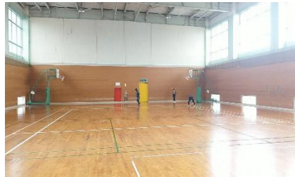
E. がらんとした体育館...