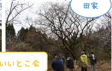
幹周り3mのエドヒガン！