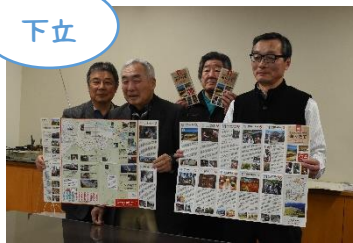
魅力満載！新マップ

下立自治振興会さんが中心となり下立ちまち歩きマップがリニューアルされた。とやま〇〇百選・立山黒部ジオパークの見どころにも選ばれる下立。「歴史・伝統ある下立地域を見ていただきたい。地域