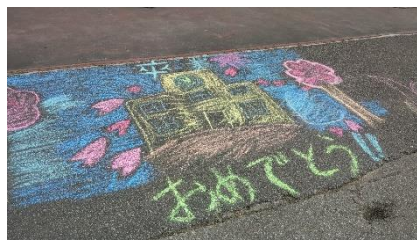
在校生からのメッセージ

中央児童センターにて「広場で遊ぼう!」が開かれました。春休みに入り、子ども達の数も少ない中で行われたこの行事では女の子たちがチョークを使い児童センターの庭を巨大キャンバスとして絵を書きました。そして出来上がったのが右の写真に写っている作品!! 卒業する子にとっては嬉しいのではないかなと思いました。