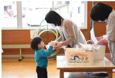
修了証書が渡されます

春になると出会いと別れがやってきますが、ここ児童センターの幼児サークルでもお別れ会が開かれました。1年間の登録制で行われてきたサークルで、最初の頃は名前を呼んでも理解が出来ない子が多いらしいのですが、この日は元気よくお返事していました。サークルを通じて子どもの成長や交友の輪が広がって、ここで出来たお友達が大人になっても続いている子もいるそうです。いくつになってもここでの思い出を大事にしてほしいなと思いました。