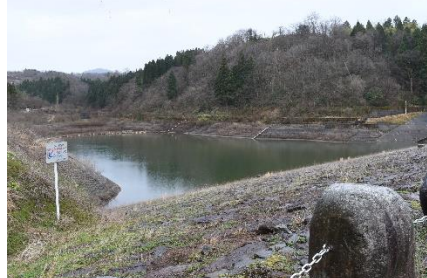
F. こう見えてダムなのです