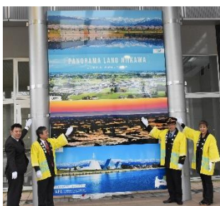
巨大パネル@新幹線駅

“地域の魅力”を共有された。名前が付いている桜はその由来も聞き、「キレイ」だけでなくストーリーを知ること、メンバー方は頷きながら魅力の再確認をされた☆