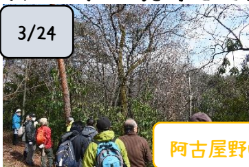
咲き始めの山桜を楽しむ