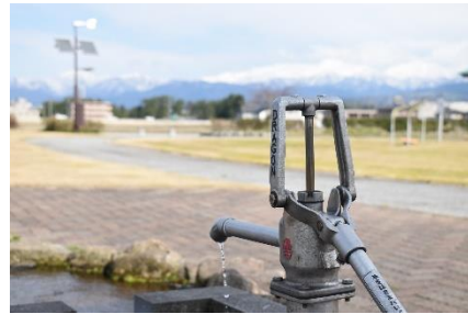
C. ポンプから水がでる