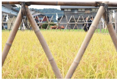
きれいな稲穂です