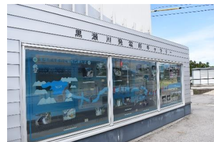
ここ、知っています？