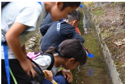
カワニナを捕っています