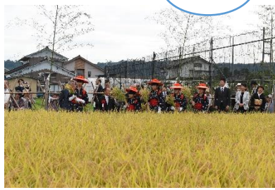
刈り取っています

若栗地区にて抜穂祭が行われました(9/22)。この抜穂祭という神事では、11月の大嘗祭のために献納されるお米を刈り取ります。稲を刈り取る刈女の女の子たちが横一列に並び、太鼓の音に合わせて一束ずつ刈り取っていきます。この刈り取られた稲が精米されて、皇居に届けられると思うとすごいことだなと感じました。