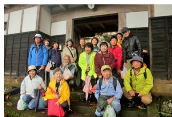
山本家門前で記念写真