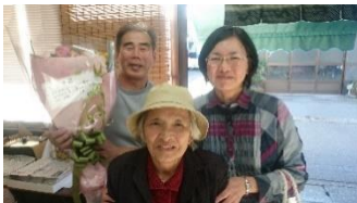
聞きつけたお客さんが花束を持ってこられました