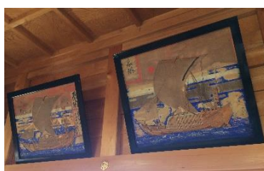
舟絵馬(諏訪金刀比羅社)