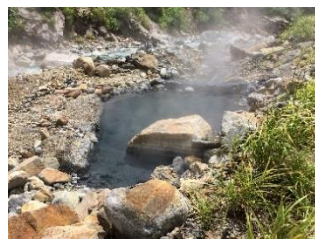
高熱の祖母谷地獄

トロッコ宇奈月駅~樺平駅~祖母谷地獄・温泉をナチュラルリストの案内で峡谷を見ながら・説明を聞きながら往復する黒部峡谷自然観察会。樺平駅⇄祖母谷温泉は往復約5.2km(2時間)、美しい祖母谷川沿いを歩き人喰岩や峡谷美、初夏には雪の橋を見ることが出来るそう。祖母谷橋では世界一新しい黒部川花崗岩(パンダ石)がゴロゴロと点在する様を見ることが出来ます。観察会は8月末・10月末の年2回行われ、今回は紅葉を満喫、疲れと肌寒さを祖母谷温泉で湯治。家族や友人・知人を誘って祖母谷温泉へGO!!