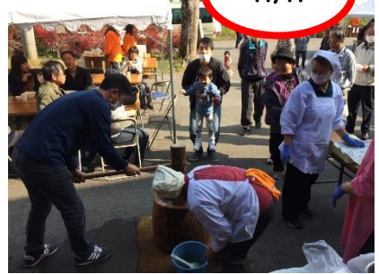
手慣れた迫力の餅つき

第21回布施谷(ふせんたん)祭りが11/11(土)に東布施トレーニングセンターで開催されました。 当日は東布施で収穫されたよもぎ山菜そばを始め、その場でついたよもぎ餅、猪肉と具だくさんのぼたん鍋などの地物を使ったフードや山菜・農作物・加工品・木炭なども販売されたくさんの方が山の恵みを手に取り・味わい、イベントを楽しみました。よもぎ餅は喉に詰らす話を思い出すくらいとても柔らかくもちもちでした。今まで食べた餅で一番おいしかったです。逃した方は来年再チャレンジ！