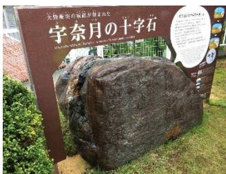
旧宇奈月庁舎前の十字石