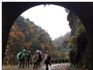
自然や植物について教わる