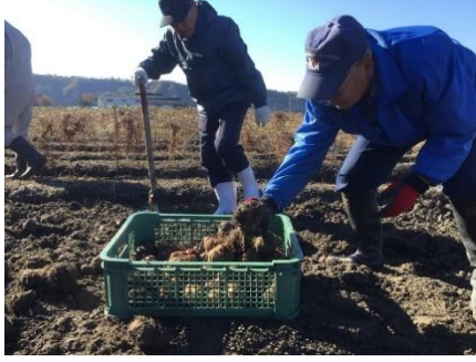
手分けして収穫する農家さん