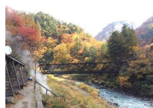
祖母谷山小屋からの紅葉