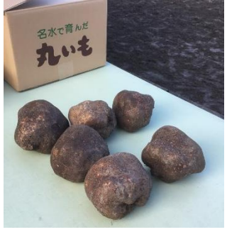
形・大きさがグッドな丸いも

11月中旬から丸いもの収穫最盛期を迎えました！！今夏は雨が少なくスプリンクラーで水を与えるなど、苦勞されたようですが、平年並みに収穫出来ているそうです！掘り起こした後は、手をかけて洗浄・乾燥、そして細いたくさんの鬚のような根を切り落とし選別。粘りが特徴の丸いも、長芋のように短冊などにして食べたり使ったり、すりおろしてスプーンですくって鍋やおつゆに入れたり、しょうゆなどで味付けして揚げたり…いろいろな使い方、食べ方が出来ます。粘りがすごくお好み焼きなら粉いらす！滋養強壮にもよい丸いも、みなさんはどう食べますか？家庭の味、美味しいレシピ教えてください☆