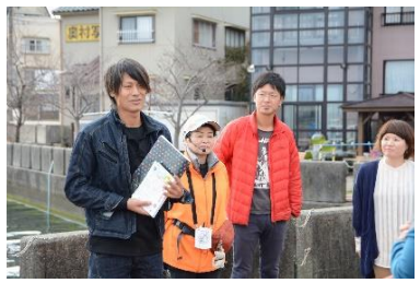
みんなで自己紹介