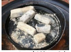
タンドリーチキンとジャガイモ