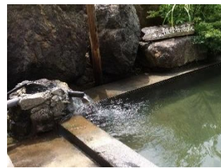
祖母谷温泉(露天男湯)