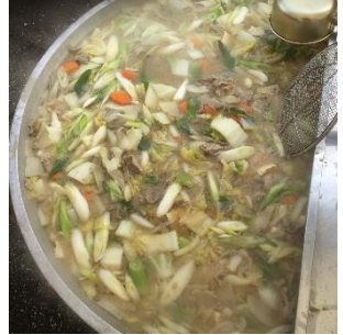
具だくさんぼたん鍋