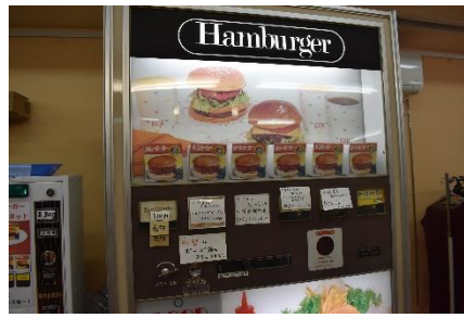
A. ハンバーガー自販機！