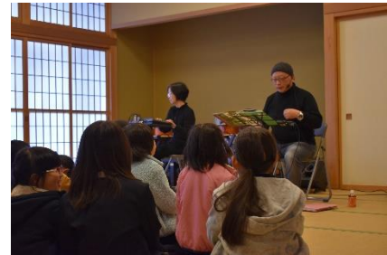
B. ひと味違う朗読会