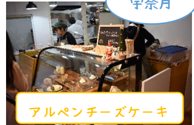
アルペンチーズケーキ