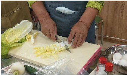
白菜を切っています