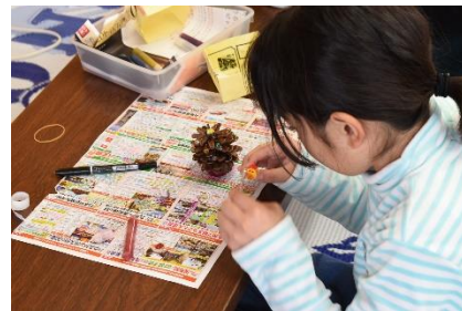
C. クリスマスに向けて