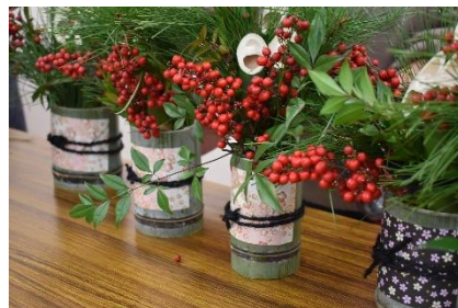
D. 新年を迎える準備