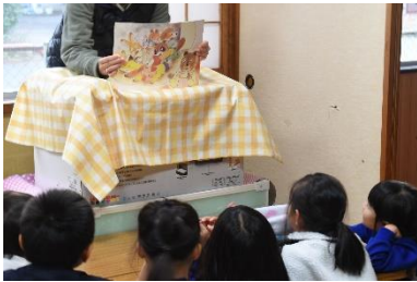
紙芝居で学んでいます！