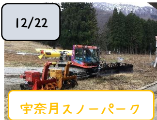
宇奈月スノーパーク