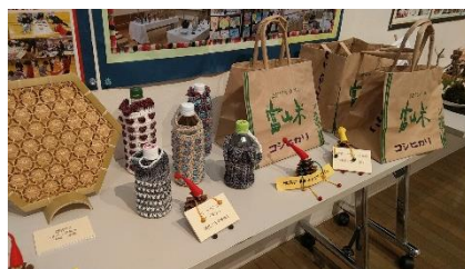
A. 奥のバックが気になる♪