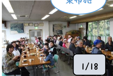
楽しい・美味しい顔が溢れた