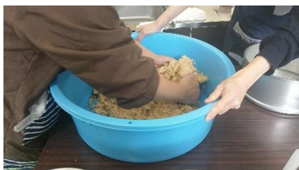
大豆・麴・塩を混ぜていきます