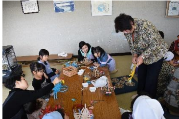
かご作りを教わる子育て世代