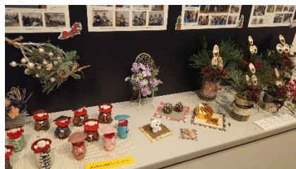
B. 手前はお地藏さんです