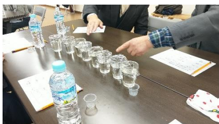
利き酒をやっています!