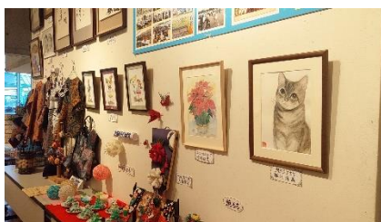
D. 猫の絵がかわいい