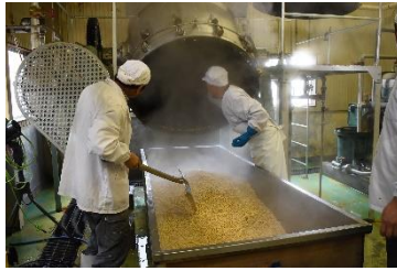
蒸し上がった大豆を湯気が覆う