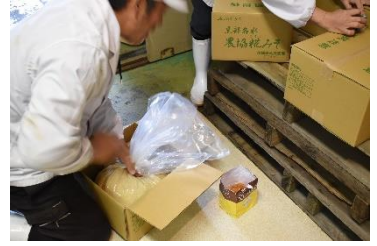
半年後の開封が楽しみだ！！

寒の時期になり、職人たちがJAくるべ大布施味噌加工場に集まった！黒部産の米(コシヒカリ)を蒸し2晩施設内の室で仕込まれる米麹、黒部産の大豆(エンレイ)のうまみを閉じ込めるよう圧力釜で蒸される味噌大豆、黒部の名水が原料の“黒部名水麹味噌”作りが行われている！1月～3月の限定仕込みのこの味噌、ほぼ約1年ぶりに作るのに手慣れた手つきと麹・大豆の具合を確認する目つきそして仕込む姿はまさに職人芸だ！袋詰めされた味噌の原料は計量後空気を抜かれるが、この空気抜きも職人技だ！自宅で保存し、8月過ぎに味噌となり食べられます！無添加で麹多めや減塩も選べる。お問い合わせはJAくるべ大布施味噌加工場(0765-54-2995)まで！