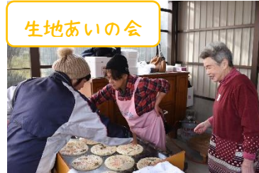
緑日では名水どんどん焼き