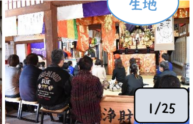
無病息災・学業成就などご祈禱