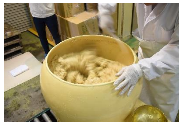
手際よく混ぜられる