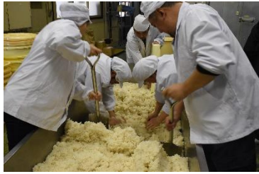
麹菌をまんべんなく混ぜる